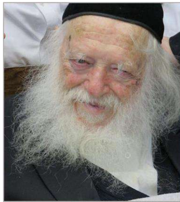
מרן שר התורה זצוק"ל

מי שמכיר יודע שהברכה של רב חיים הייתה מסתכמת ב"בוה" (ברכה והצלחה) אבל בשביל הדבר הזה הוא אמר כל כך הרבה מילים... נקודה למחשבה. ולא הפסדתי!