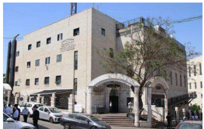
ישיבת מיר

הרב יצחק יפונה שליט"א מספר את מעשה הנורא ששמע מהגאון רבי גרשון מלצר שליט"א, מרבני ישיבת מיר בירושלים: "הרב מלצר שליט"א נוסע מידי יום מביתו לישיבה בירושלים עם נהג קבוע, ובמשך הזמן הנהג ובנו ב"ה התחזקו מאוד בשמירת התורה והמצוות, בקביעת עיתים לתורה ועוד, יום אחד הנהג אומר לרב שליט"א "יש משהו שמפריע לי מאוד להתחזק לגמרי: איך זה יכול להיות שישנם של אברכים שיושבים ולומדים הלכות עם פאות ששערן יותר מושך משיער של נשים חילוניות?"