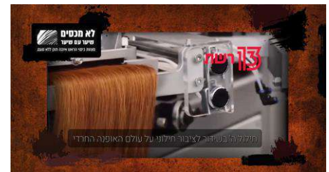
תפירת פאות (לא מכסים שיער עם שיער)

מיום ליום חשתי שאינני מסוגלת להמשיך בעבודה זו המצפון העיקר עלי ידעתי שמעשי לא רצויים והייתי בוכה ותופרת בוכה ותופרת ואומרת להקב"ה, במילים שלי אבא אתה יודע שאני לא רוצה לעשות נגד רצונך.