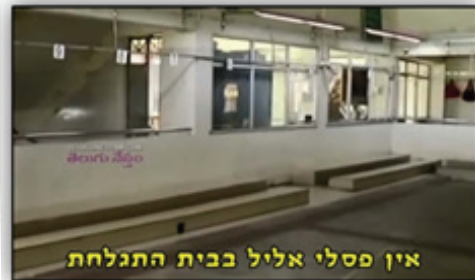
אין פסלי אליל בבית התגלחת