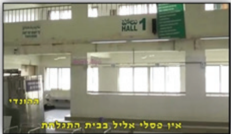
אין פסלי אליל בבית התגלחת