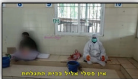
אין פסלי אליל בבית התגלחת

בבית התגלחת אין פסלי אליל, יושבים זקופים ולא משתחוים, והידים אינן על הלב