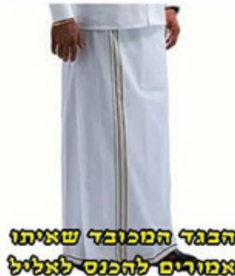
הבגד המכובד שאיתו אמורים להכנס לאליל

תמונות מתוך ספר הכצעקתה בו הם מציגים את העבודות החשובות להם, ומציגים זאת כאילו הם נעשים רק בבגדים חשובים אלו.