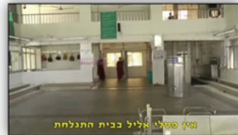
אין פסלי אליל בבית התגלחת

עמוד מתוך הכצקתה בו הם מביאים תמונות מתוך סרטון, ומציגים כביכול אין צלמים בבתי התגלחת.