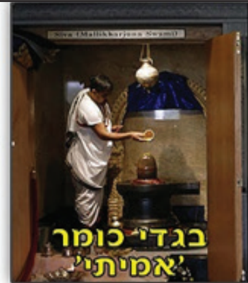
בגדי כומר 'אמיתי'

לעבודותיהם הרציניות לע"ז - ההינדים מתייחסים ברצינות ובמכובדות