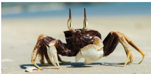
תמונות של סרטנים

[כ] כדי למנוע חשש של תקרובת ע"ז, אפשר לקנות פאה 100% סינטיטי ולשלוח למעבדה של בדיקת שעטנז, שיבדקו שאין בו