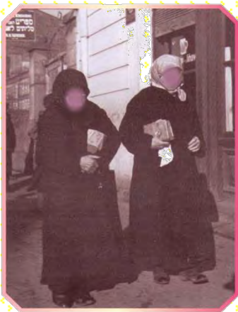
נשים יפודיות מקצרות אפיק כנסת בפרוץ

ובהרבה מקומות גם אחרי תקופה זו הלכו כל הנשים בבגדים ארוכים שכיסו