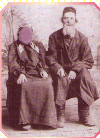
צאנז יפודי נאיטא אפיקא בפרוץ בניצוח