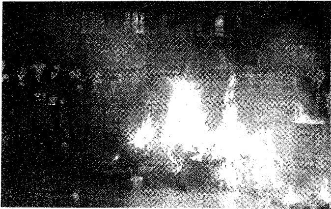
דער מעמד קידוש השם אין קרית יואל מוצט"ק ביים פארברענען שייטלען פון תקרובת עבודה זרה

ניו יארק- די טיף-איינגעבאקענע אמונה טהורה פון כלל ישראל איז במשך די פארגאנגענע וואך געקומען צו איר פולן שיין, ווען די שערורי' מיט די מענטשן-האָר שייטלען האָט דראַמאַטיש אויפגעפלאַקערט אויף אַן און די גאַנצע אירישע וועלט מסוף העולם ועד סופו איז איינגעהילט געוואָרן אין איין און אינעם זעלבן זאָרגפולן גאַלאַפּ זיך אַפּצוטרייסלען פונעם איסור תקרובת עבודה זרה ר"ל. עס איז אַן צווייפל פאַרגאַנגען אַ