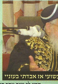
לולי תורתך שעשועי אז אבדתי בעוני